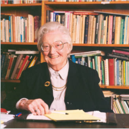
Cicely Saunders, die Begründerin der modernen Hospizbewegung